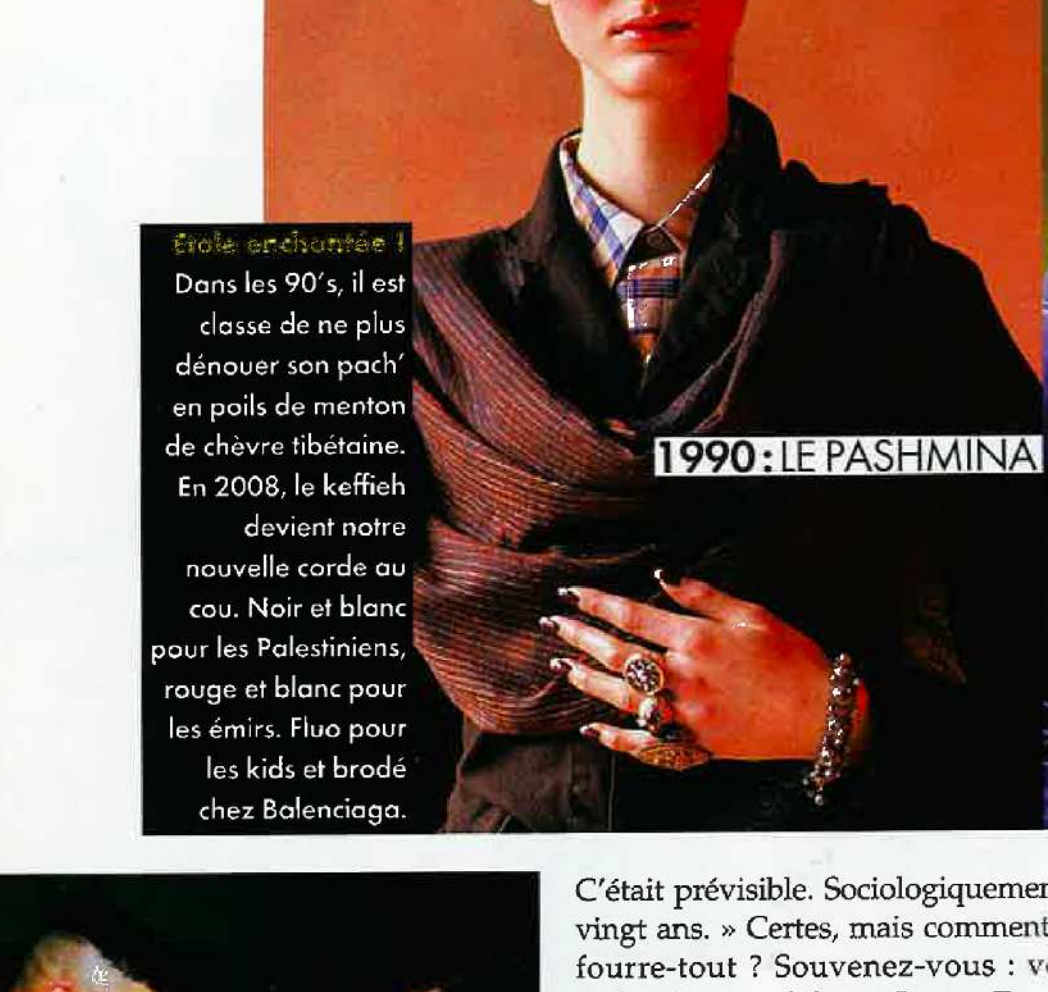
1990 : LE PASHMINA