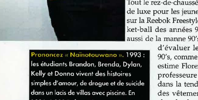
2008 : « 90210 »

Prononcez « Nainotouwano ». 1993 : les étudiants Brandon, Brenda, Dylan, Kelly et Donna vivent des histoires simples d'amour, de drogue et de suicide dans un lacis de villas avec piscine. En 1996, 6 900 Dylan naissent en France. « Beverly Hills » s'arrête en 2000. Mais le feuilleton revient en septembre 2008, sous le nom « 90210 ». Dans ce « spin off », la série dérivée diffusée aux États-Unis, les acteurs renouvelés, encore financièrement à l'aise, sont r'n'brisés au goût du jour. Shannen Doherty, Jennie Garth et Jason Priestley font même partie du casting.