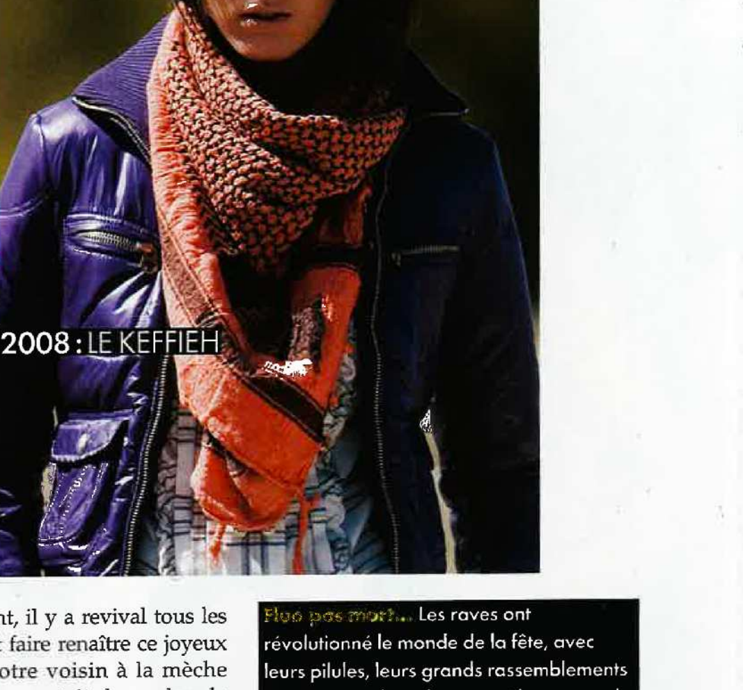
2008 : LE KEFFIYEH

Étoile d'opportuniste ! Dans les 90's, il est classé de ne plus dénouer son patch en poils de menton de chèvre tibétaine. En 2008, le keffiyeh devient notre nouvelle corde au cou. Noir et blanc pour les Palestiniens, rouge et blanc pour les émirats. Fluo pour les kids, et brodé chez Balenciaga.