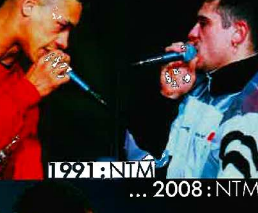
1991 : NTM

Étoile d'opportuniste ! Dans les 90's, il est classé de ne plus dénouer son patch en poils de menton de chèvre tibétaine. En 2008, le keffiyeh devient notre nouvelle corde au cou. Noir et blanc pour les Palestiniens, rouge et blanc pour les émirats. Fluo pour les kids, et brodé chez Balenciaga.