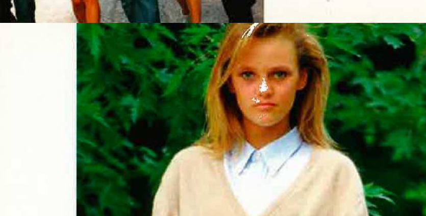
2008 : « LES CH'TIS »