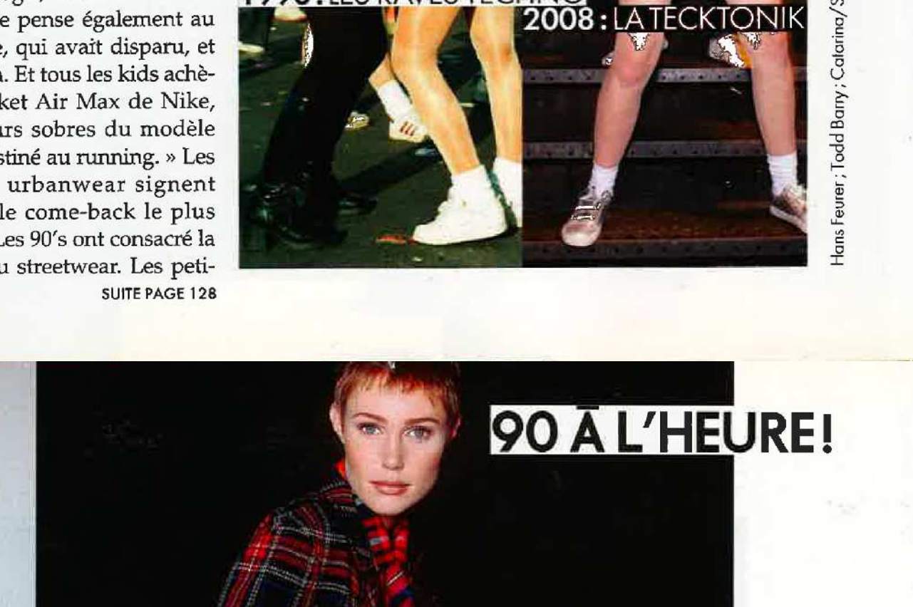
2008 : LE TARTAN CHIC