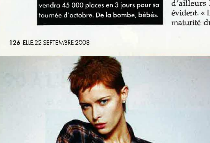
1994 : LE CARREAU GRUNGE