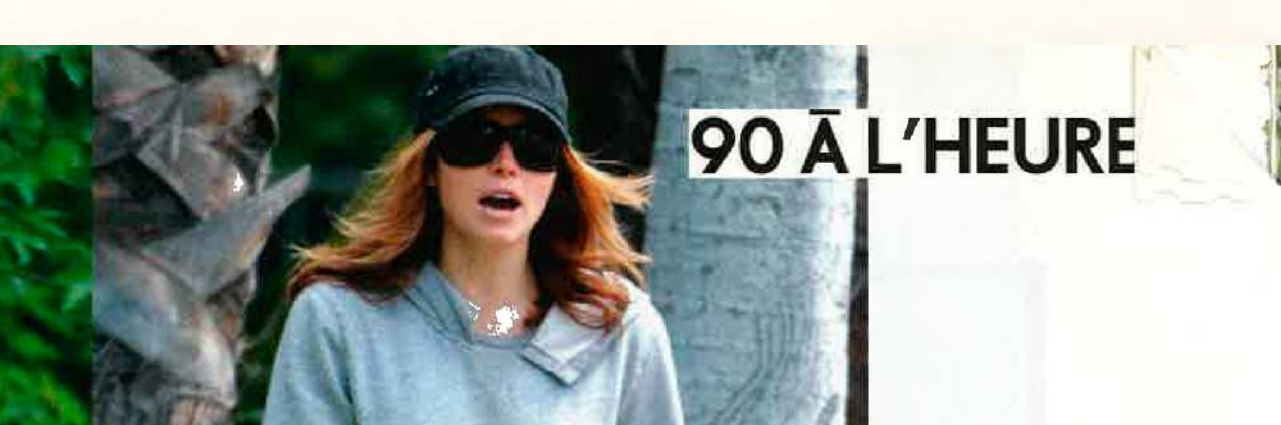
2008 : L'IPHONE

Le portable, ça nous a toujours deux fois. En 1993, c'est la révolution : on lance le B-Bop, le premier portable français ! Top frime. Mais il fait vite un flop, supplanté par les GSM, plus performants. Fin 2007, lancement de l'iPhone, dont l'écran tactile et les services élaborés sont censés dénicheter leurs baggys. Sur les forums internet, on discute sec d'ateliers ciseau et pierre ponce pour tailler en pièces son denim.