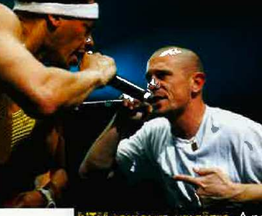
2008 : NTM

Plus que mort... Les raveurs ont révolutionné le monde de la fête, avec leurs pillules, leurs grands rassemblements sous ecstasy, leurs baggys et leurs sons de marteau piqueur signés Laurent Garnier. Jusqu'à se faire oublier. Surgit la Tecktonik en 2007, une danse électro cooptée par des millions d'ados à travers le monde. Même principe de dress-code - la crête, le slim fluo -, même style de musique, même idée du geste robotique - ici, le passage frénétique de la main dans les cheveux.