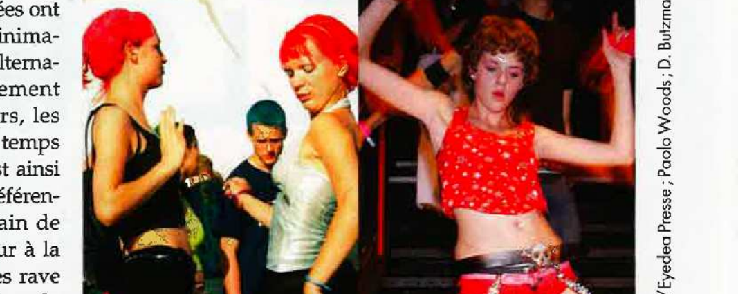
1990 : LES RAVES TECHNO

Et, en attendant, avec quoi nourrit-on son discman ? Avec NTM, bien sûr ! Extinction des feux en 1998, rebirth en 2008 face à un public qui s'est juste arrêté de respirer entre-temps. « Pour leur nouvelle tournée, deux dates de concert ont été * L'Institut français de la mode. SUITE PAGE 130