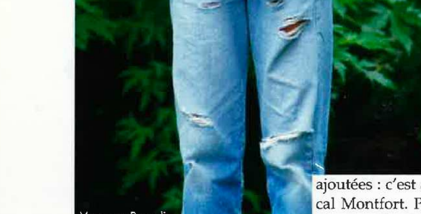
2008 : « LES CH'TIS »

* Auteur du livre « Le Culte du banal » (CNRS éditions).